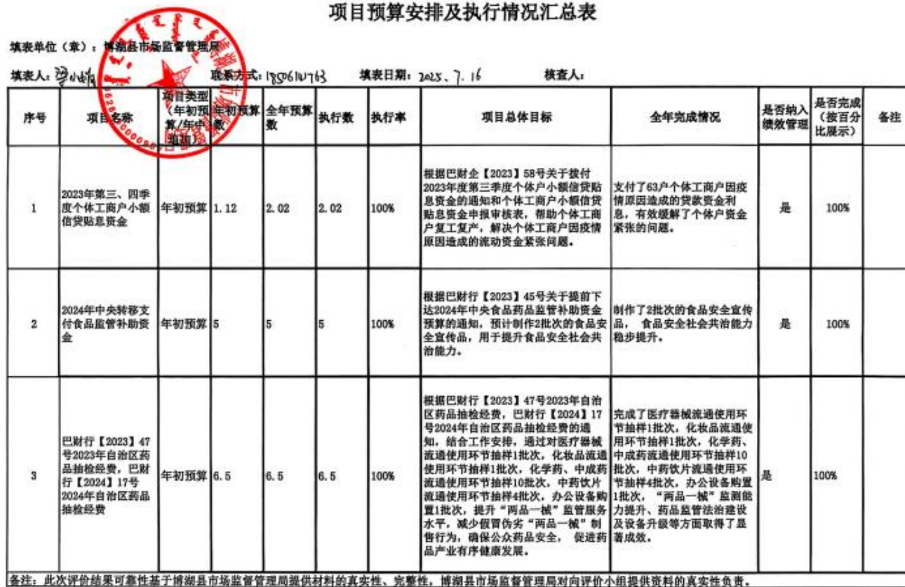
基础表 1 博湖县市场监督管理局 2024 年度项目预算安排及执行情况汇总表