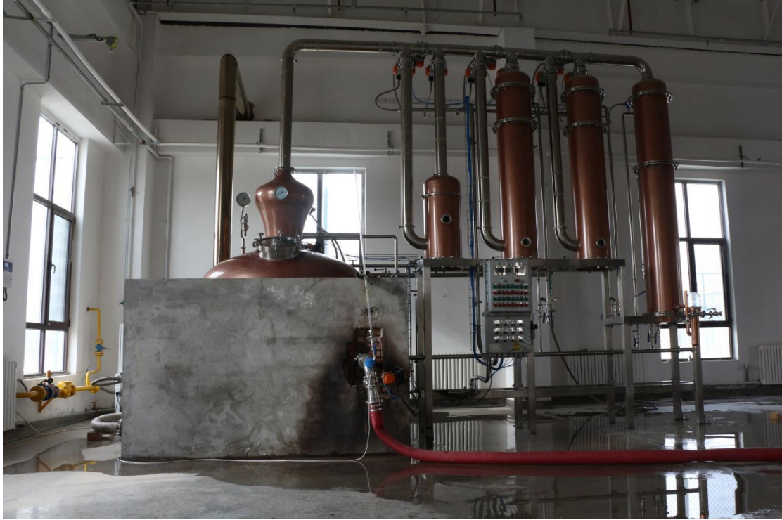
(阿尔马涅克蒸馏设备)