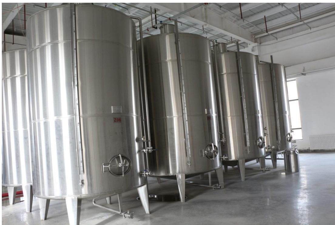
(蒸馏车间 10KL 不锈钢罐)